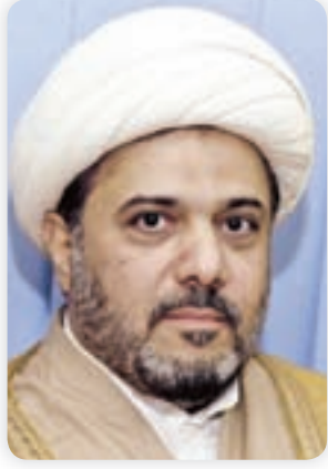
• الشيخ راضي الحبيب

شهدت قضية التزام الرياضة النسائية بالحجاب تفاوتاً سياسياً وعلى خلفية اعتراض بعض النواب على الظواهر السلبية في هذا الشأن قال الباحث الاسلامي الشيخ راضي حبيب في تصريح صحافي لـ «الوطن»: «استغرب ما صدر عن بعض النواب من تصريحات اعتراضية ضد احتجاج لجنة الظواهر السلبية البرلمانية في شأن عدم التزام الرياضة النسائية بالحجاب معلقين عليها بأنها «عمل فاضي» وأخر يصفها بـ «توافه الأمور» وأخر يقول بـ «عدم دستوريتها» من الأصل!! وكل ذلك لأنها تعمل على الحفاظ على المظهر الاسلامي للمجتمع عن طريق مواجهة الظواهر السلبية في المجتمع. وأضاف: اننا لو المحدثا النظر قليلا لاستشعرنا من الخطاب الالهي أنه قد أعطى مسألة «الحجاب» الأهمية الكبرى والأولية في الذكر القرآني حيث أنه تعالى قد تناول ذكر الحجاب على نحو التفصيل في خطابه القرآني في عدة موارد ومواطن وسور ولم يؤخره لمرحلة البيان النبوي في السنة النبوية بخلاف ما انتهجه في ذكر وجوب أمر الصلاة الذي ذكره في خطابه على نحو الاجمال تاركا تفصيل أفعالها لمرحلة البيان النبوي مما يدل بـدلالة صريحة على أهمية وضرورة وجوب الحجاب على المرأة المسلمة وذلك صيانة لعفتها.